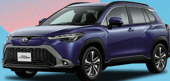
※Photo:カローラクロス Z(ハイブリッド・2WD)。ボディカラーのスパークリングブラックパールクリスタルシャイン(220)は別途メーカーオプション(33,000円)。価格には含まれておりません。