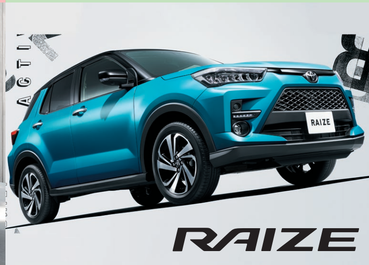
※Photo:ライズ Z (ガソリン・2WD)。ボディカラーのブラックマイカメタリック (X07)×ターコイズブルーマイカメタリック (B86) [XH6]は別途メーカーオプション (55,000円)。BSM (ブライズスポットモニター)+RCTA (リアクロストラフィックアラート)は別途メーカーオプション (66,000円)。スマートパノラマパーキングパッケージは別途メーカーオプション (147,400円)。価格には含まれていません。