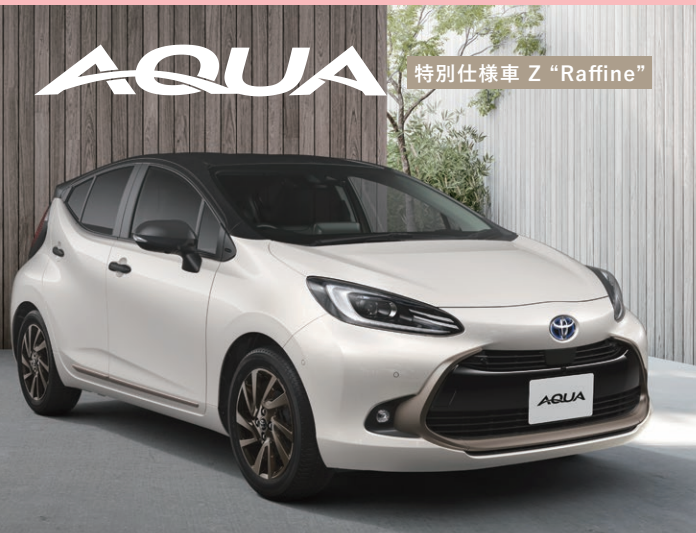
特別仕様車 Z "Raffine"