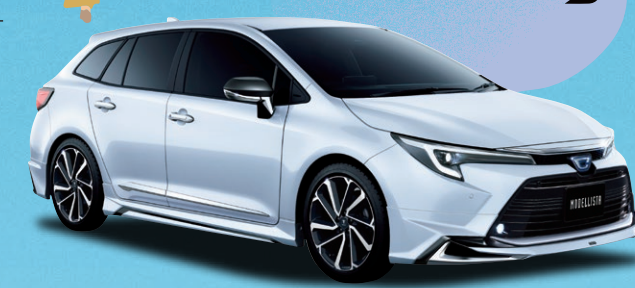
※Photo:カローラツーリング WxB(ハイブリッド車・2WD)。MODELLISTAエアロ装着車。ボディカラーのプラチナホワイトパールマイカ(089)は別途メーカーオプション(33,000円)。価格には含まれておりません。