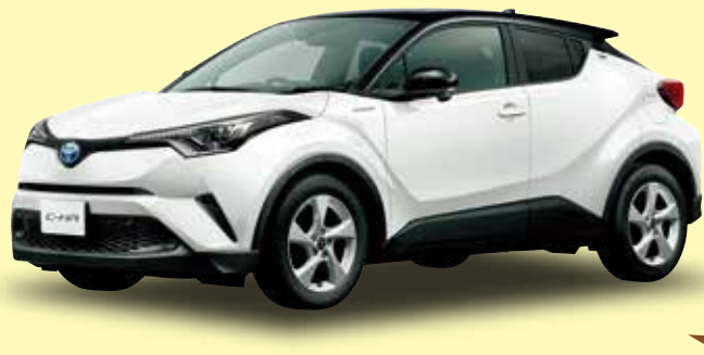
Photo: C-HR S“LED Package”. ボディカラーのブラック(202)×ホワイトパールクリスタルシャイン(070)[2NA]は別途メーカーオプション(54,000円高)。価格には含まれておりません。

C-HR 特別仕様車 S“LED Package” 車両本体価格 2,670,000円*1 [1800ccハイブリッド・2WD・5人乗り]