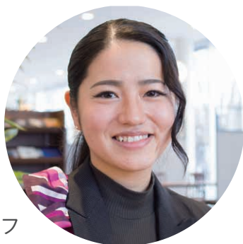
営業 大須賀スタッフ [入社2年目]

また、新入社員育成のシステムとして職場先輩制度を導入し、仕事上での疑問や不明なことについては、「店舗教育担当者」として任命された先輩スタッフが親身にサポート。その他、3か月に一度の「新人フォロー研修」や「勉強会」などを通して、段階的なスキルアップを図っていきます。