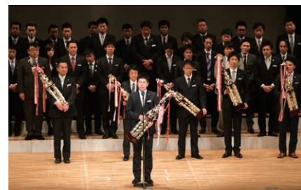
宮城トヨタグループ 総合表彰