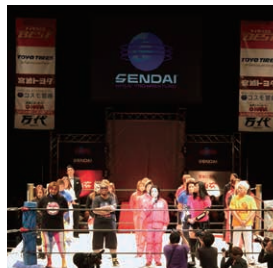
センダイガールズプロレスリング