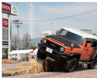
宮城トヨタ ランクルフェス