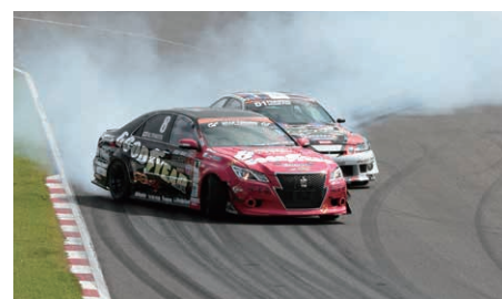
MTG Motor Festival in SUGO