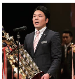
センダイガールズプロレスリング